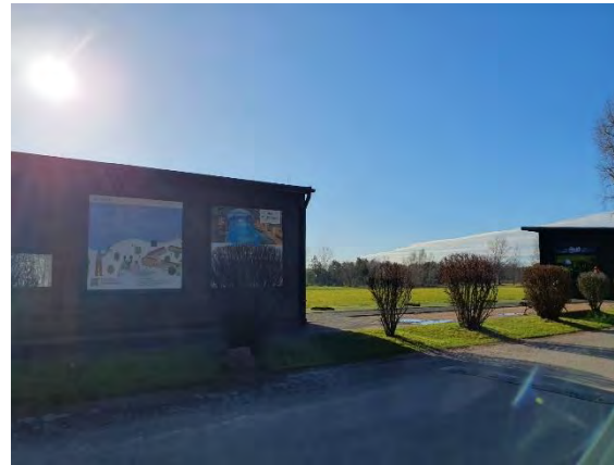
Anzeige Golfplatz Kladow